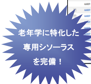
シソーラス検索画面例