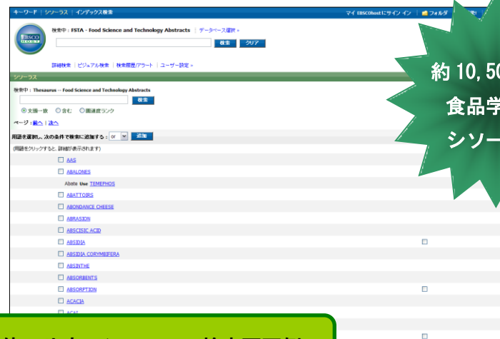
使いやすいシソーラス検索画面例